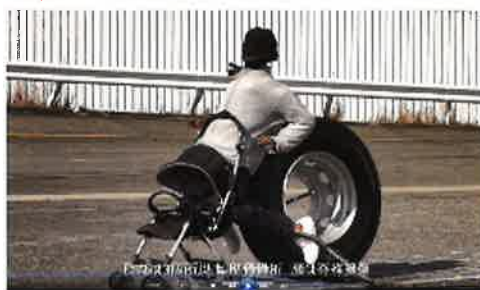
車輪脱落事故啓発動画より (R2. 国交省作成)