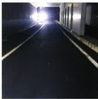
舗装補修後イメージ