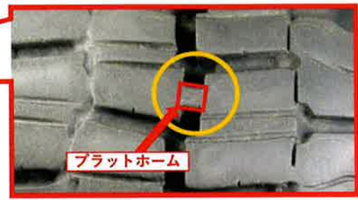
タイヤが摩耗し、残り溝深さが「プラットホーム」に達している状態。冬用タイヤとして使用できません。