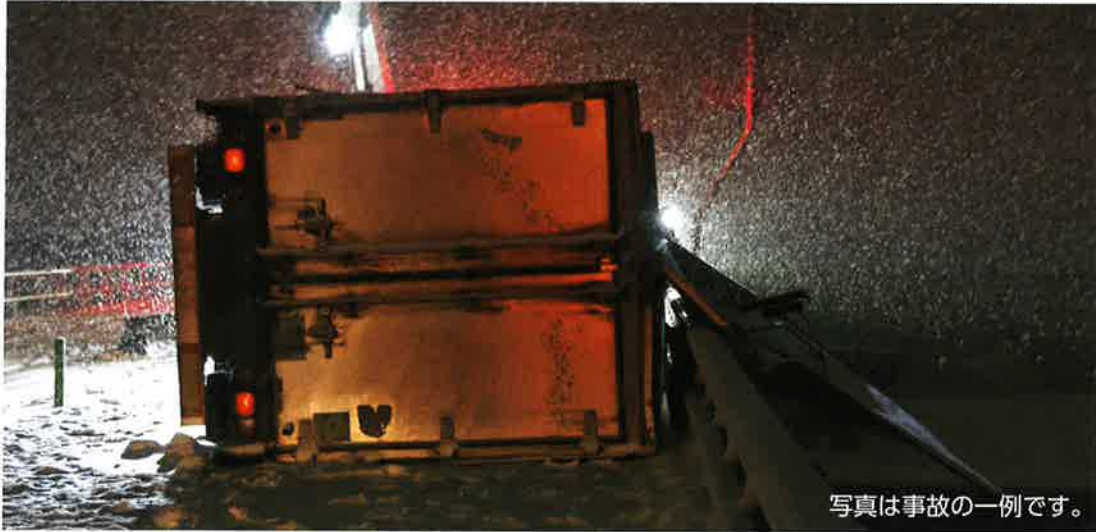
写真は事故の一例です。