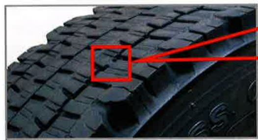
プラットホームは新品時は溝の内側1/2の高さにある段差です。

溝深さが50%以上残っていることを「 プラットホーム 」で確認しましょう。 （一部海外メーカー品は除く）