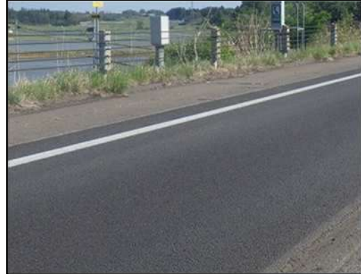
舗装補修完了状況(イメージ)