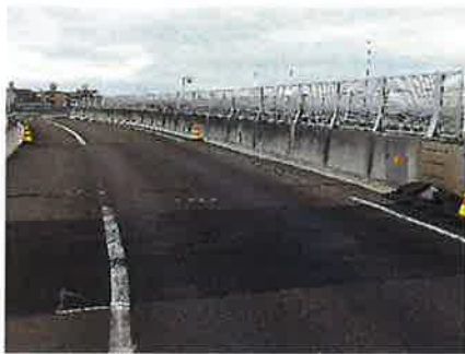
伸縮装置損傷状況

そのため、お客さまへ極力ご迷惑をおかけしないよう、昼夜連続のランプの閉鎖を行い、工事を集中的かつ効率的に実施します。安全・快適に高速道路をご利用いただくために必要な工事ですので、ご理解とご協力をお願いします。