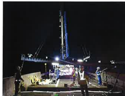
伸縮装置取替工事 作業状況