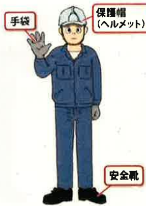
作業者に身につけてほしい望ましい装備例