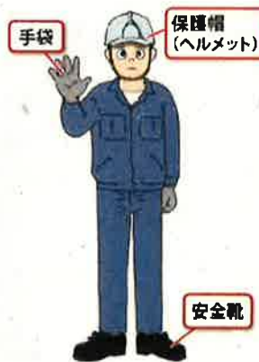
作業者に身につけてほしい望ましい装備例