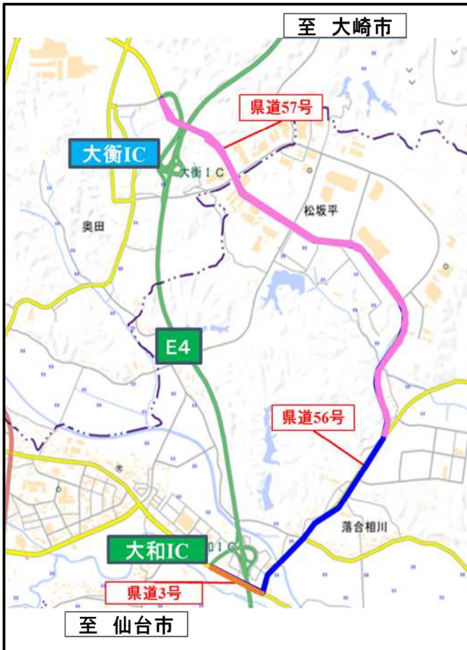
大和IC～泉IC・富谷ICの迂回路