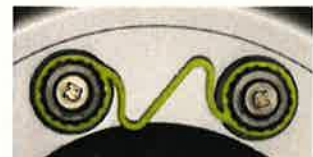
左右のホイール・ナットが緩んだ状態