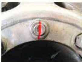
ホイール・ナットへのマーキング例

ホイールナットマーカ一等を活用した新たな点検方法や車齢4年以上の車両に車輪脱落事故が多く発生していることを踏まえ、ホイール・ボルト及びホイール・ナットの交換目安等が規定されました。