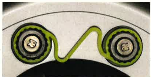
左右のホイール・ナットが緩んだ状態