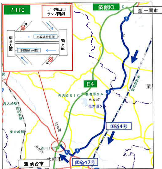
【1】築館IC～古川ICの迂回路