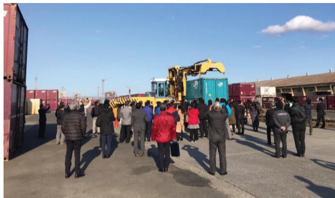
2020年度 鉄道コンテナ見学会の様子(仙台貨物ターミナル駅)