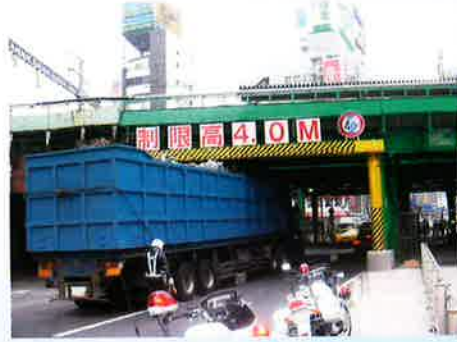
二葉橋ガード 外堀通り