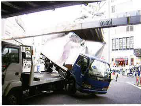
仲原街道ガード ハツ山通り