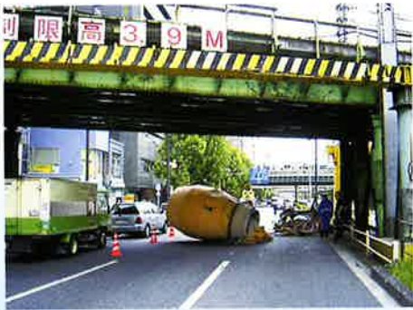
小柳橋ガード 靖国通り