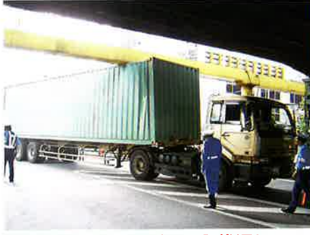
呉服橋ガード 国道1号永代通り