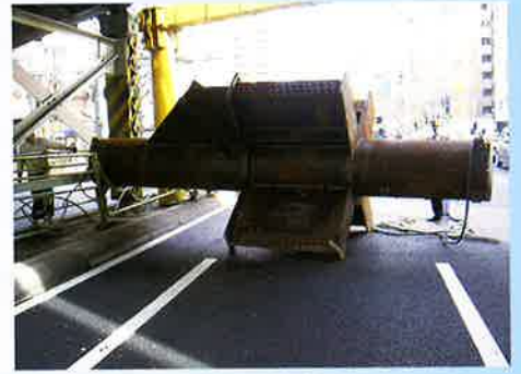
万世橋ガード 中央通り