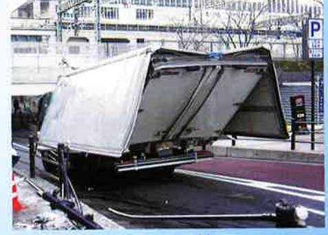
明神坂ガード 神田明神通り