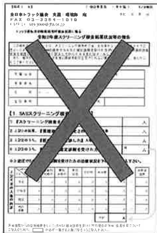
令和2年度末で FAX・メール報告廃止