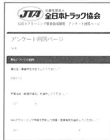
令和3年度から Web回答フォーム