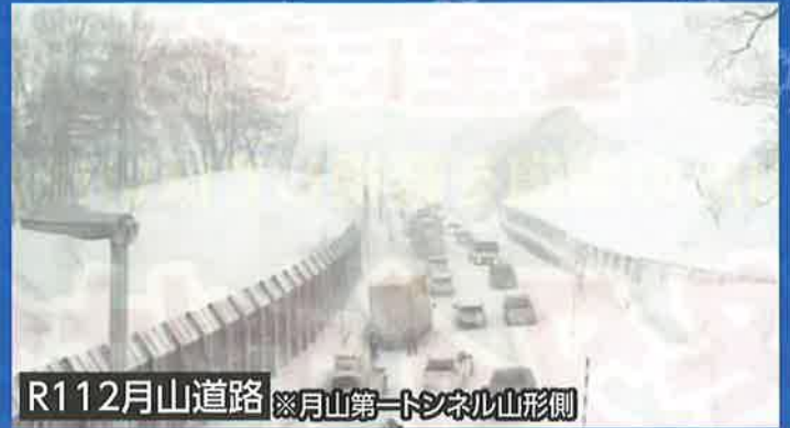
R112月山道路 ※月山第一トンネル山形側