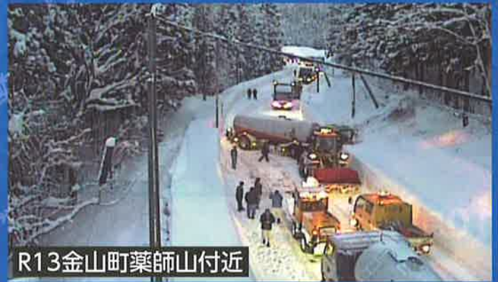
R13金山町薬師山付近