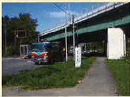
■工事箇所(国道48号線から望む)