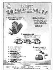
▲エコドライブポスター