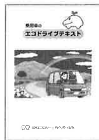
▲エコドライブテキスト 乗用車版 (200円/冊)

当財団で作成したエコドライブテキスト(乗用車版、トラック版、各200円/冊)、「エコドライブ10のすすめ」チラシ・ポスター(無料)、コンクールリーフレットの表紙(電子データ)、優秀取組事例集(電子データ)、燃費管理ツール(ウェブサイト)、参加証明書(電子データ)などを用意しています。