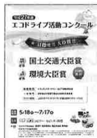
▲コンクールリーフレット (電子データのみ提供)