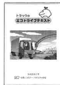
▲エコドライブテキストトラック版 (200円/冊)