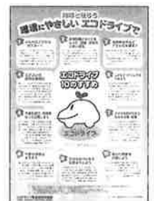
▲エコドライブチラシ