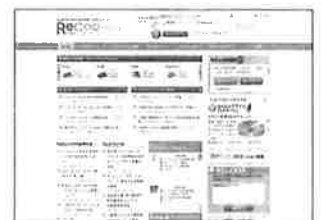
▲燃費管理支援サイトReCoop (無料/別途登録必要)