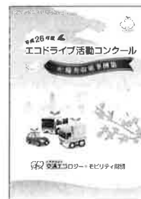
▲優秀取組事例集 (電子データのみ提供)