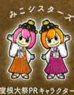
室根大祭PRキャラクター

御輿御下り / 午前4時~神社 御輿先着争い~仮宮遷宮 / 午前7時頃~町内、祭場 祝詞奉上~御輿還幸 / 午前9時30分~祭場、町内