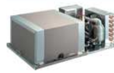
定置型冷凍 冷蔵ユニット